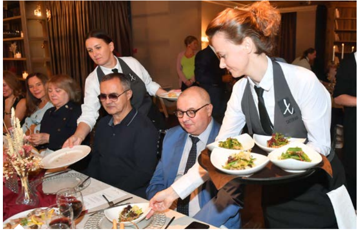
Gastronomi alanından Rus ilgililerin yoğun ilgi gösterdiği etkinlikte ünlü Şef Arda Türkmen'in hazırladığı bulgurlu lezzetler ikram edildi.