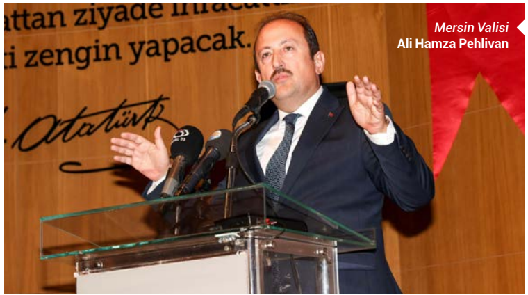
Mersin Valisi Ali Hamza Pehlivan

AHBİB 2023 Yılı İhracatın Yıldızları listesinde 7 firmanın Mersin merkezli olmasından büyük memnuniyet ve mutluluk duyduğunu vurgulayan