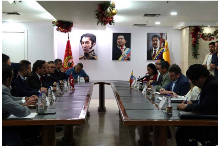
Türkiye kafiləsi, Venezuela Üretken Tarım ve Arazi Bakanı General Menry Fernandez ve beraberindeki yetkililerle bir araya gelerek istişarelerde bulundu.

Venezuela pazarında toplam 1,2 milyar dolar hacmi bulunan potansiyel tarım ve gıda ürünleri tablosunda ise ilk sırada 325,5 milyon dolar hacimle soya fasulyesi yağı üretiminden arta kalan küspe ve katı atıklar yer alıyor. Bunu 160,7 milyon dolar hacimle kamış/pancar şekeri ve kimyaca saf sakkaroz (katı halde) takip ediyor. Bu ürünlerin ardından 112,3 milyon dolar değer ile tarifenin başka yerinde yer almayan gıda müstahzarları, 102 milyon dolar değer ile buğday unu, 96,4 milyon dolar değer ile makarnalar ve kuskus, 77,2 milyon dolar değer ile kakao içermeyen şeker mamulleri, 71 milyon dolar değer ile tatlı bisküviler ve gofretler, 53,7 milyon dolar değer ile soya fasulyesi, 45,2 milyon dolar değer ile etil alkol, 39,2 milyon dolar değer ile hayvan gıdası olarak kullanılan müstahzarlar yer alıyor.